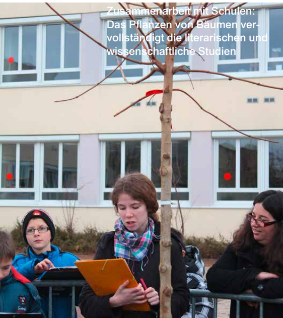
Zusammenarbeit mit Schulen: Das Pflanzen von Bäumen vervollständigt die literarischen und wissenschaftliche Studien