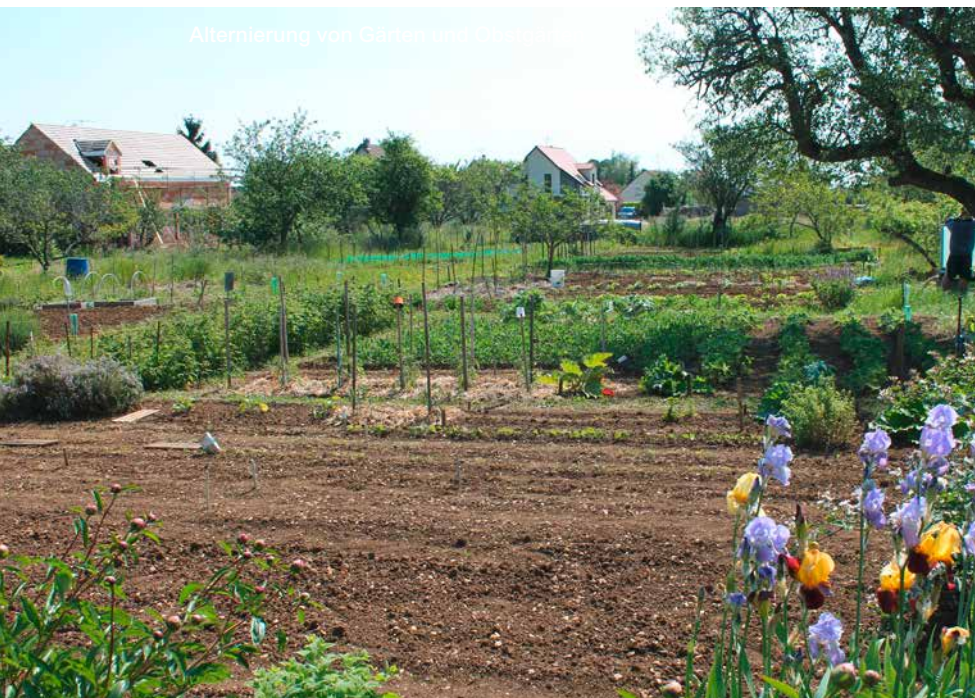
Alternierung von Gärten und Obstgärten