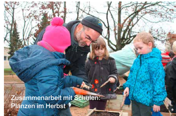
Zusammenarbeit mit Schulen: Pflanzen im Herbst

Diese Maßnahmen werden vervollständigt durch Obstgärten zur Erhaltung von Obstsorten, dem botanischen Pfad der Hauptschule, dem Garten für Senioren, Schulgärten, alles umrahmt von Weinbergen und reglementiert durch ein striktes Lastenheft, in Bezugnahme auf die Bauungsmethoden. Diese ländliche Schutzzone muss auch in das Peri-