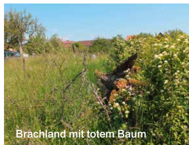
Brachland mit totem Baum

ger (Guano) und hat einen Ort für das gemeinsame Kompostieren zur Verfügung gestellt.