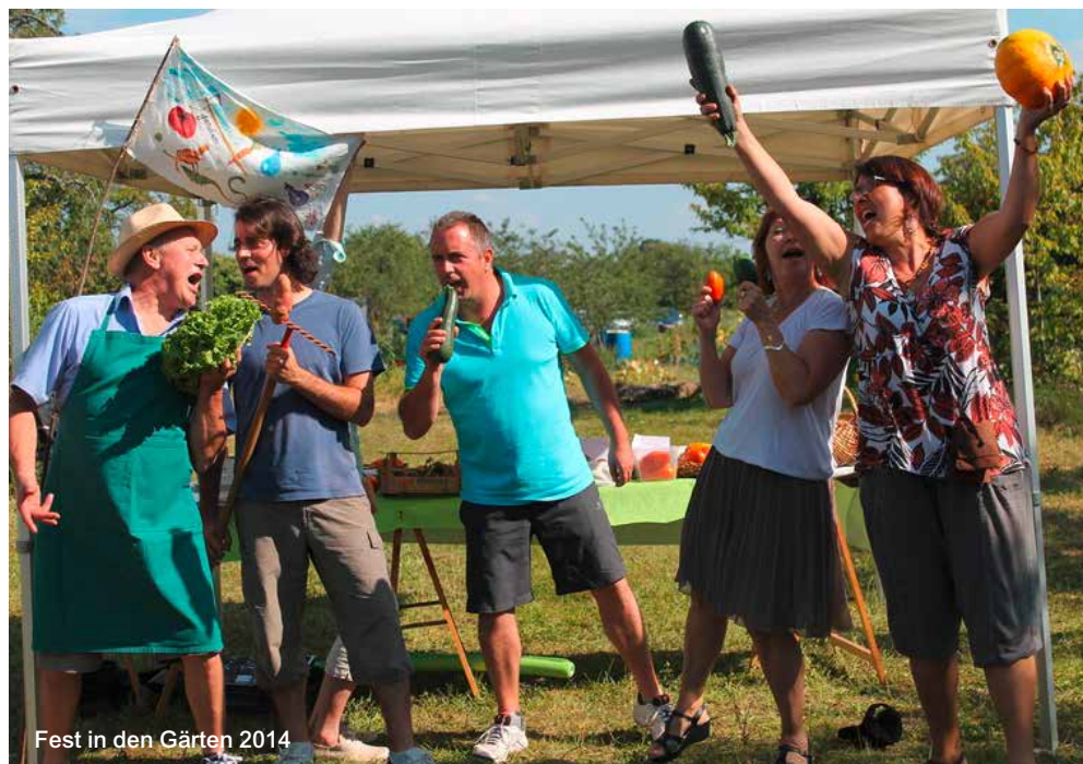
Fest in den Gärten 2014

So wurde der Verein JVMC, welcher am Anfang negativ betrachtet wurde, ein aktiver Verein, welcher viele Vorschläge machte und dann auch