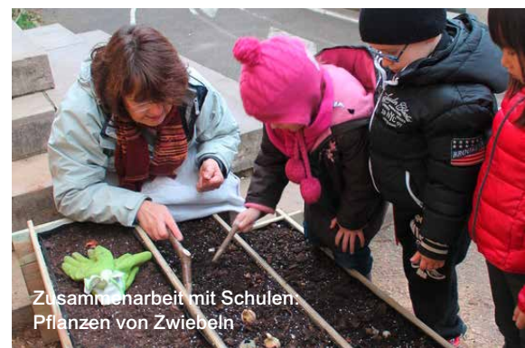
Zusammenarbeit mit Schulen: Pflanzen von Zwiebeln