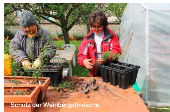
Schutz der Weinbergpfirsiche

meter des geschützten Areals "Côte de Nuits" eingegliedert werden, welches in Ausarbeitung ist und für 2017 geplant ist.