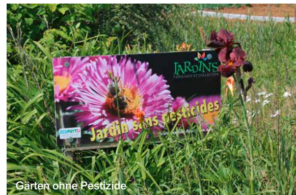
Gärten ohne Pestizide