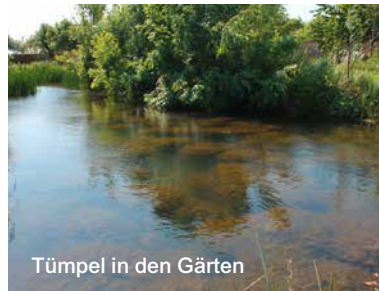
Tümpel in den Gärten

de Säuger beherbergt (Rehe, Kaninchen) aber auch unsere Bienenstöcke, welche von einem Imkergärtner überwacht werden. Nur die Schmetterlinge sind noch nicht Objekt einer speziellen Studie geworden, welche jedoch von dem Insektenforscher des Naturkundemuseums in Dijon versprochen wurde.