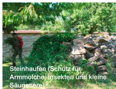
Steinhaufen (Schutz für Armmolche, Insekten und kleine Säugetiere)

Das heißt dass wir nicht erwägen ein Insektenhotel oder einige artifizialen Tümpel zu errichten, denn hier sind alle Bedingungen im natürlichen Zustand gegeben. Es kann nicht gelehnet werden dass dieses Resultat nur durch das seit 2004 strikte Verbot (internes Reglement) phytosanitäre Produkte zu gebrauchen, sowie durch eine Spätmahd, Asthaufen, tote Bäume, Steinhaufen, die Bedeckung des Bodens (Strohbedeckung) erreicht werden konnte. Die Igel, welche die Gegend verlassen hatten sind 2014 wieder zurückgekommen. JVMC liefert durch einen Gesamteinkauf den Kompost (4 Tonnen in 2015), Biodün-