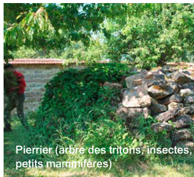
Pierrier (arbre des tritons, insectes, petits mammifères)

à une couverture du sol (paillage)... Les hérissons qui avaient déserté sont revenus en 2014. JVMC fournit en achat groupé le compost (4 tonnes en 2015) les engrais bio (guano) et a mis en place une aire de compostage collectif.