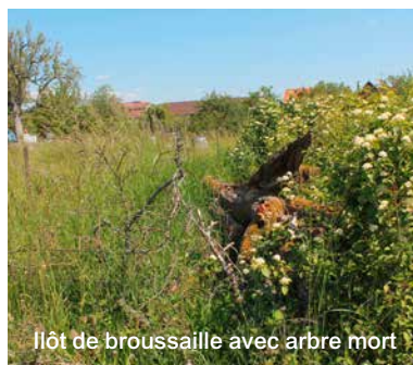
Îlot de broussaille avec arbre mort