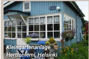
Kleingartenanlage Herttoniemi, Helsinki