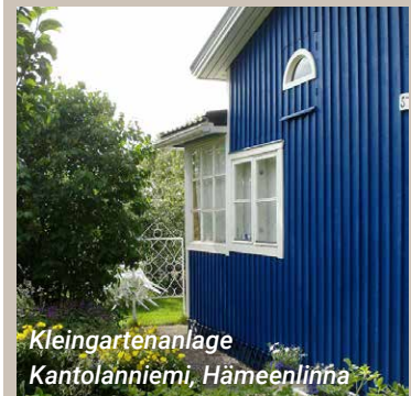
Kleingartenanlage Kantolanniemi, Hämeenlinna