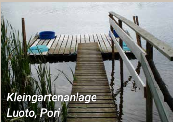
Kleingartenanlage Luoto, Pori