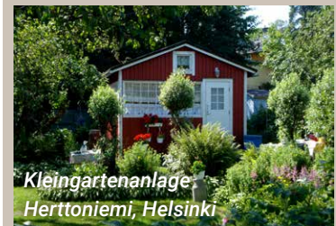
Kleingartenanlage Herttoniemi, Helsinki