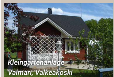
Kleingartenanlage Valmari, Valkeakoski