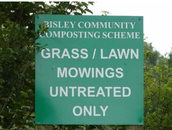
Drei Schilder, welche den Mitgliedern mitteilen, wo sie die verschiedenen Materialien ablagern sollen.