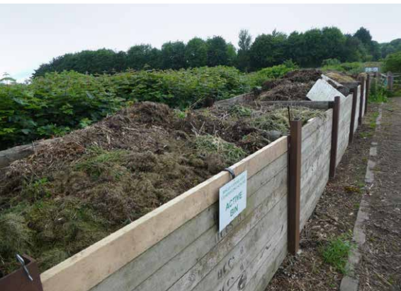
Die Behälter werden beschichtet, aber hier sieht man die Schichten von braunem Shredder Material und grünem Rasenschnitt vor dem ersten von zwei Drehungen.