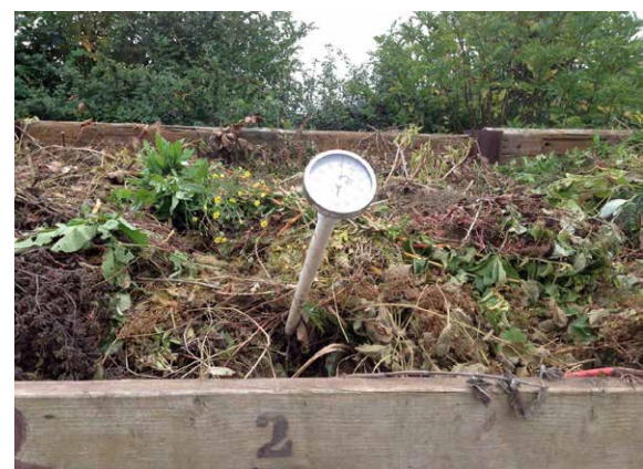
Die Kompostierungsbehälter während dem Kompostieren mit dem Thermometer.

www.bisleycommunitycompost-scheme.org.uk