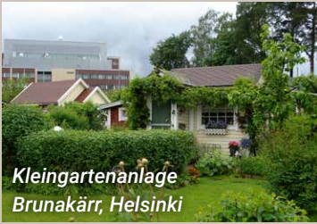
Kleingartenanlage Brunakäär, Helsinki