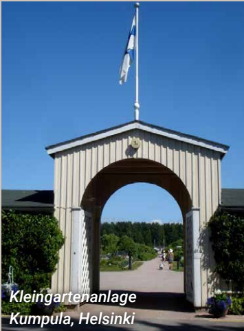
Kleingartenanlage Kumpula, Helsinki