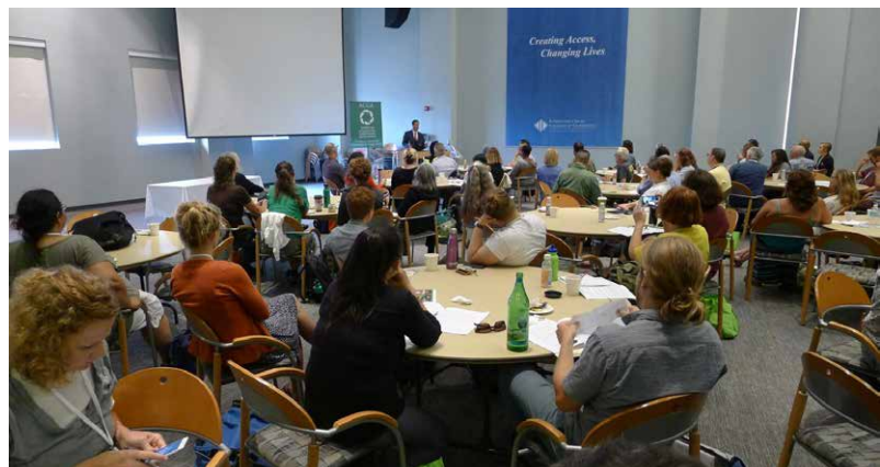
Vorträge, Workshops, Diskussionen