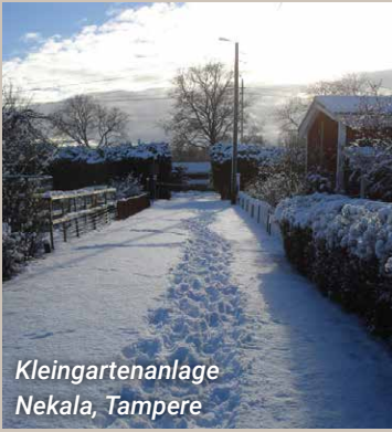
Kleingartenanlage Nekala, Tampere

500 Kilometer sind die Entfernung zwischen den Kleingärten an der Westküste und den Kleingärten, welche am weitesten östlich gelegen sind. Im Westen reduziert die Nähe zum Meer die Dicke der Schneeschutzbedeckung, aber der Boden ist fruchtbar und das Gärtnern ist von Schweden beeinflusst.