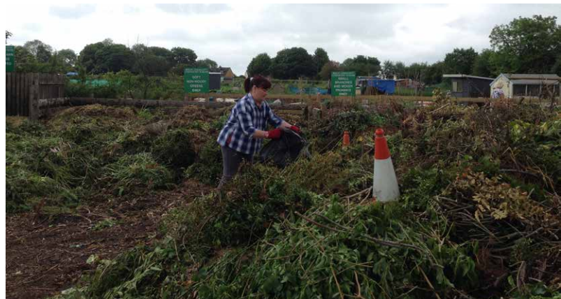
Ein Mitglied bringt Holzschnitte in die Kästen bevor sie zerkleinert und sortiert werden. Dies geschieht durch Freiwillige in Teilzeitarbeit.

Kleingärtner haben nie genug guten Kompost! In Bisley (GB) haben wir unser Problem gelöst indem wir ein „Community Composting Scheme“ (Gemeinschaftskompostierungsprojekt) initiiert haben.