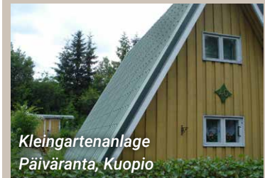
Kleingartenanlage Päiväranta, Kuopio