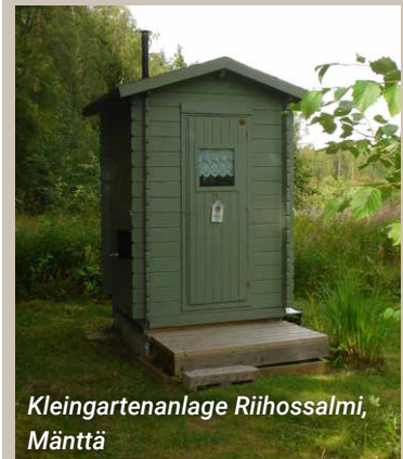
Kleingartenanlage Riihossalmi, Mänttä