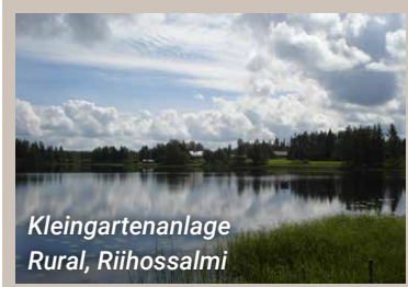
Kleingartenanlage Rural, Riihossalmi