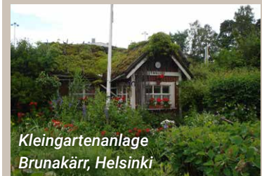
Kleingartenanlage Brunakärr, Helsinki