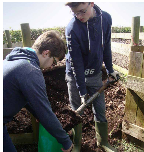
Studenten für Gartenbau von der Thomas Keble Secondary School füllen Säcke mit Blattschnitt.