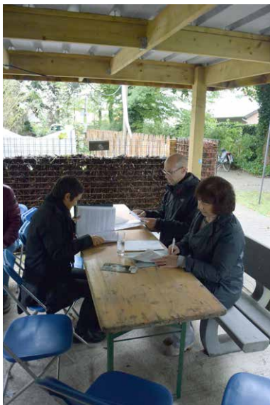
3) Vom Beginn dieses Projektes an, haben sich der örtliche Vorstand und die lokale Regierung für das

Verwenden einer dauerhaften Ausstattung und dauerhaften Materialien entschieden. Sie pflanzten einheimische Pflanzen und entfernten invasive Arten. Um natürliche Feinde und andere nützliche Tiere in den Garten anzuziehen, errichteten sie Igel- und Bienenhotels. Sie stapelten Zweige und Blätter in der Anlage auf.