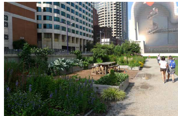
Essbare Gärten in öffentlichen Grünanlagen in Boston.