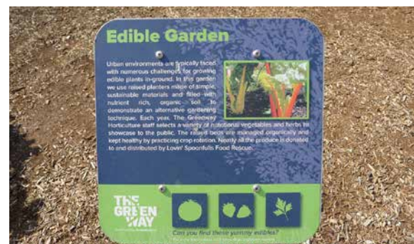
Der Besucher erfährt so mehr über den naturnahen Anbau von Gemüse und Mischkultur. Die Ernte wird an Hilfsorganisationen gespendet.