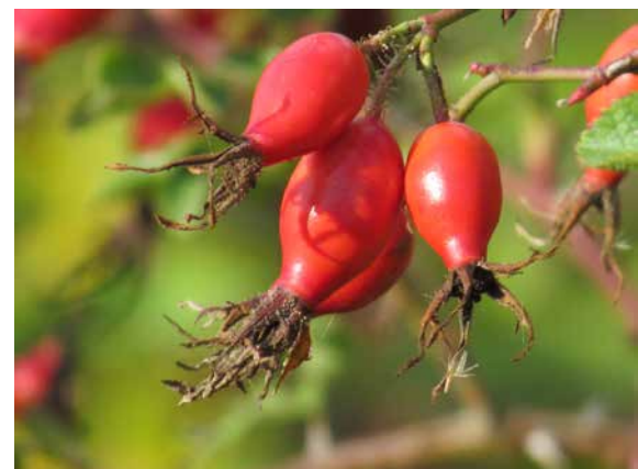
Wildfrüchte in einem Kleingarten