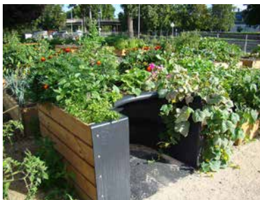
Üppige blühende viereckige Beete der Fontaine d'Ouche in Dijon (21), Zwei Monate nach ihrer Einweihung.