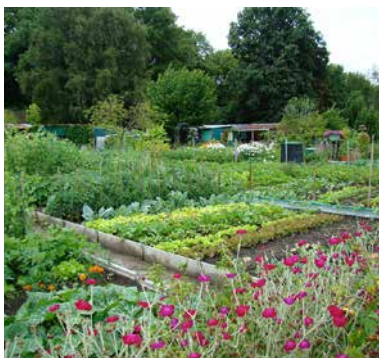
Traditioneller Familiengarten in Versailles, wo man den Anbau von Gemüse und Blumen sowie einige Obstbäume findet.