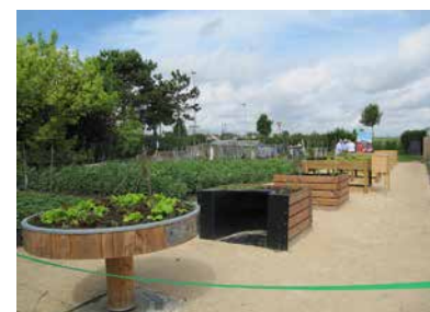
Verschiedene Typen von Parzellen für Behinderte in Quetigny (21).

a) Kleingärten: Ein Kleingarten ist ein relativ großes Grundstück (1 bis 2 Hektar, manchmal sogar mehr), welches normalerweise das Eigentum der lokalen Behörden ist. Es wird den Vereinen verpachtet und diese brauchen oft keine Pacht zu zahlen.