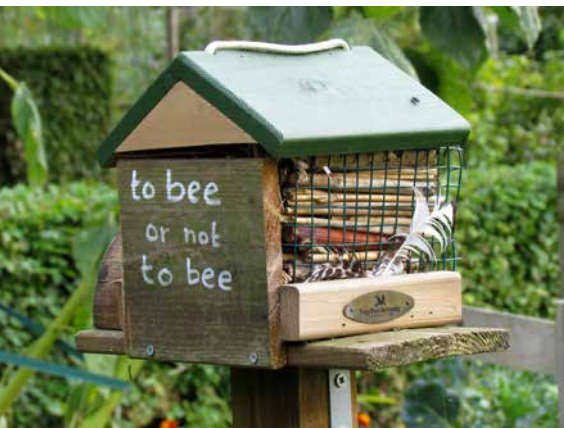
Bed & Breakfast in einem Kleingarten