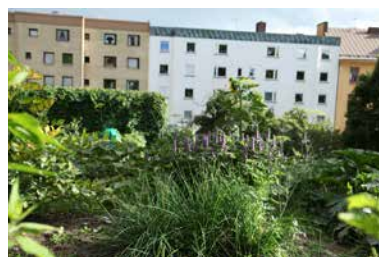
Der Waldgarten-Teil des Hoegalid Urban Garden befindet sich unterhalb einer Kirche, nur einige Meter von der Anzucht am Dach.