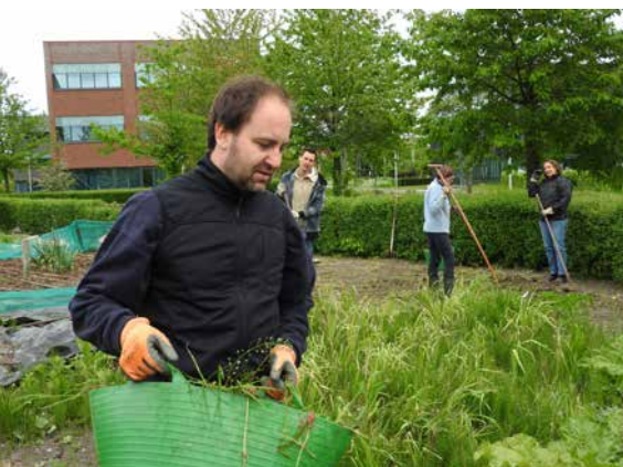
Vorbereiten des Gartens auf eine neue Saison in einer Kleingartenanlage

Heute beobachten wir in den Niederlanden eine starke Beziehung zwischen neuen Formen des organisierten Gemeinschaftsgartenbaus – wie z. B. städtische Landwirtschaft, Nachbarschaftsgärten, Naturgärten, Lebensmittelgärten – und den länger bestehenden Kleingärten. Wie lässt sich das erklären?