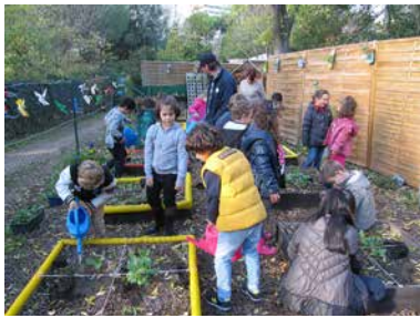
Schulgarten in Mazargues (Marseille).