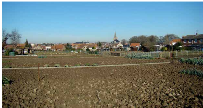
Traditionelle Kleingartenanlage in Hazebrouck (Norden von Frankreich). Die Parzellen sind groß und dienen ganz dem Gemüseanbau.