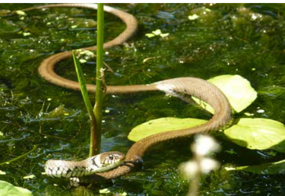
Natur im Gartenpark

Eigenes Essen anbauen und die Natur genießen, das ist etwas ganz Besonderes. Wir sind Zeugen einer energischen Bewegung von Bürgern, die mit ihr arbeiten. In den Niederlanden haben wir in den letzten 15 Jahren eine Vielzahl von Initiativen in den Bereichen Natur, Grün, Lebensmittelanbau, Ökologie und Biodiversität in der Stadt und auf dem Land erlebt. Die meisten von ihnen sind klein und für die Nutzung durch Anwohner gedacht. Leider sind Gemeinschaftsgärten oft nur vorübergehender Natur, auf Brachflächen, wo z. B. Häuser gebaut werden müssen. Wir beobachten jedoch Partnerschaften und große soziale Unternehmen, die auf der Wiederentdeckung des Gartenbaus beruhen. Natur- und Umweltorganisationen beleben sich mit neuer Energie und ziehen viele Freiwillige an.