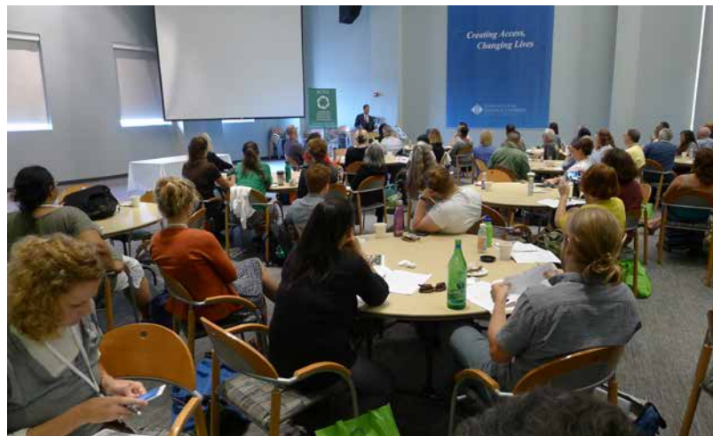
Vorträge, Workshops, Diskussionen

Schon seit knapp vier Jahrzehnten treffen sich Jahr für Jahr bis zu 400 Gartenaktivisten auf den Tagungen der American Community Gardening Association (ACGA). Gartenfreunde unterschiedlicher Herkunft und Ausbildung bereichern dann mit vielen frischen Ideen die zahlreichen Workshops und Vorträge, unterstützt durch Wissenschaftler und Grünexperten von Universitäten, Firmen und Behörden.