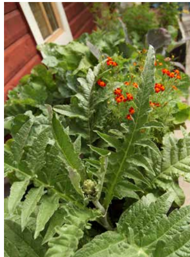
Artischocke und Tagetes Linnaeus