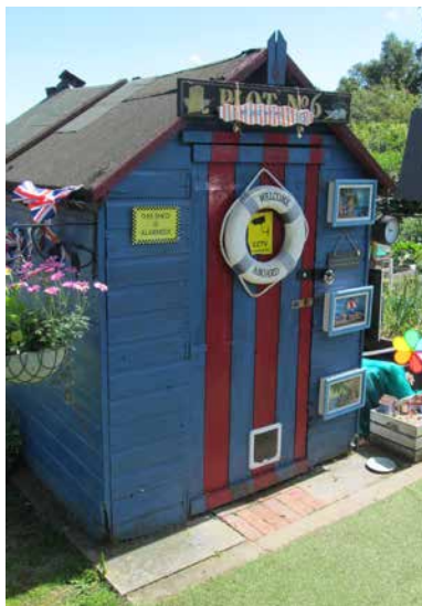
Ein exzentrischer, englischer Schuppen.

fentlich, die die Situation in Schottland und Nordirland schildert. Lokale Behörden können Kleingärten zur Verfügung stellen, sie haben allerdings keine gesetzliche Pflicht dies zu tun. Weitere Gesetze, die Kleingärten betreffen, wurden in den letzten Jahren verabschiedet, das letzte war der „Localism Act“ im Jahr 2011.