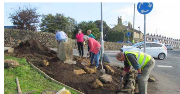
Eine „In Blüte“ Gruppe bereitet ein Blumenbeet vor.

Zusätzlich gibt es noch private Kleingartenanlagen, die entweder an die