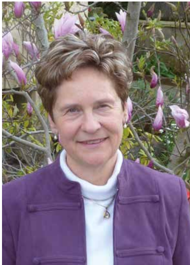
Generalsekretärin des Office International du Coin de Terre et des Jardins Familiaux a. s. b. l.

Generalsekretärin des Office International