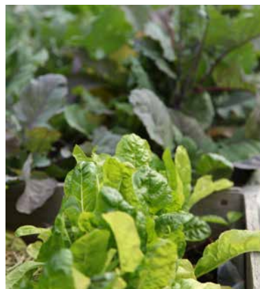
Salat am Dach