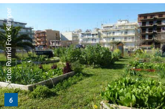
Kipos3-Gemeinschaftsgarten mit Einzelbeeten in Thessaloniki, Griechenland

in erster Linie um den Anbau lebensnotwendiger Nahrungsmittel zu gehen. Untersuchungen zur Motivation der Gärtnerinnen und Gärtner in einer 2012 gegründeten Kleingartenanlage im Umfeld von Athen (Anthopoulou 2016) zeigen zum Beispiel auf, dass die Gärtnerinnen und Gärtner an erster Stelle Motive benennen, die ihre physische und psychische Gesundheit („gesünder und bewusster essen“, „Bewegung an der frischen Luft“) oder die besondere Lebenssituation der häufig arbeitslosen Gärtnerinnen und Gärtner adressieren („Entwicklung einer lokalen Identität“, „etwas Sinnvolles machen“, „Wege aus der Isolation“). Diese Untersuchung bestätigt die Vermutung, dass die Motivation für urbanes Gärtnern in einem europäischen Kontext weniger aus einer erzwungenen Selbstversorgung, sondern vor allem aus dem Wunsch nach einem gesunden Lebensstil und nach Teilhabe gespeist wird. Hier bestehen offenbar deutliche Parallelen zwischen Gärtnerinnen und Gärtnern „neueren Typs“ und klassischen Kleingärtnern.