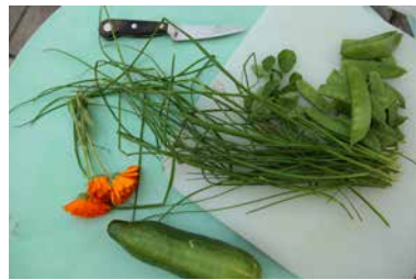
Ernte des Abends

Die herangezogenen Pflanzen haben tiefgrüne, blühende Blätter, Beeren und Früchte. Die Gärtnerinnen und Gärtner ernten Bohnen, Gurken, Rote Beete und Schnittlauch für alle. Ein leichter Regen fällt, aber das macht nicht viel aus. Bald scheint die Sonne wieder und die Gärtnerinnen und Gärtner essen herzhaft.