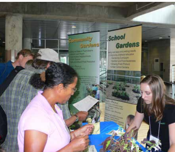
Verschiedene Umweltorganisationen informieren im Rahmen der ACGA-Tagungen über ihre sozialen und ökologischen Projekte.

Geschäftsführer des Landesverbandes der Kleingärtner Westfalen-Lippe