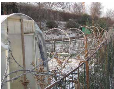
„Befestigte Gärten“ in der Vorstadt von Paris. Sie tun alles um den Besucher zu entmutigen!