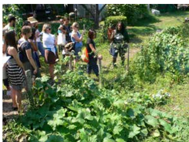
Gemeinschaftsgärten sind auch eine Antwort auf die globale Wirtschaftskrise – Kongressteilnehmer besuchen Gärten der „Bed Stuy Farm“ in Brooklyn.

und dem „Schutz von Grünflächen“ andererseits, vorprogrammiert.