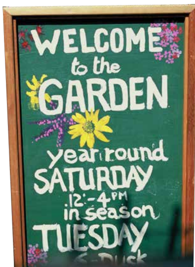
Besucher sind herzlich willkommen.

Hinzu kam, dass die Stadt ihre Zuständigkeitsbereiche änderte. Gemeinschaftsgärten wurden bisher von der Parkbehörde verwaltet. In Zukunft sollte das Amt für Wohnungsbau die Kleingartengrundstücke verwalten. Damit war ein Interessenkonflikt, nämlich der von „Bauen“ einerseits