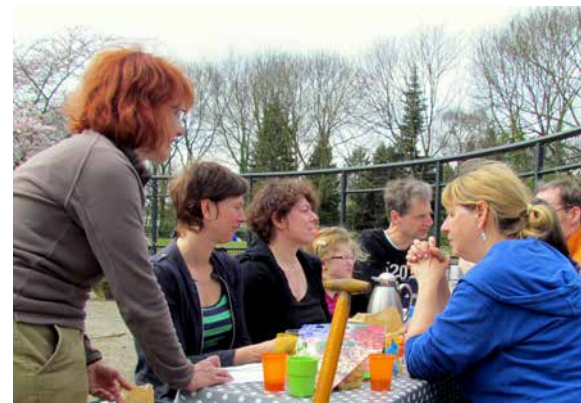
Planen der Arbeiten im Frühling in einem Gemeinschaftsgarten