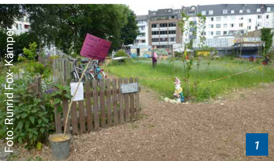
Gemeinschaftsgarten HirschGrün, Aachen, Deutschland