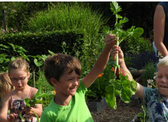
Kinder ernten in ihrem Kindergarten in einem Kleingarten