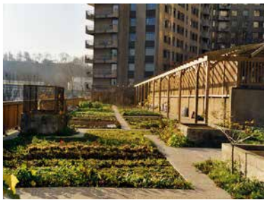
Geteilte Gärten in Boulogne Billancourt (92 - Hauts-de-Seine).