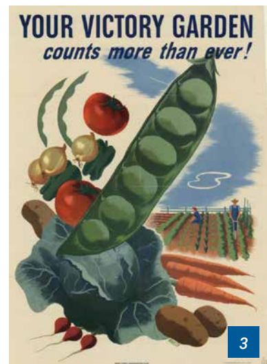
Plakat „Your Victory Garden counts more than ever!“

Das Aufkommen von Gemeinschaftsgärten als Reaktion auf gesellschaftliche Herausforderungen bis hin zu krisenhaften Entwicklungen in Städten wiederholt gewissermaßen die Entstehung der Kleingartenbewegung in europäischen Städten, die historisch belegbar mit gesellschaftlichen Umbrüchen und vor allem deren wirtschaftlichen Folgen verknüpft ist (für eine ausführliche Darstellung der Geschichte der Kleingärten vgl. Kesavarz & Bell 2016). Die Wurzeln der Kleingartenbewegung reichen zurück bis in die Mitte des 19. Jahrhunderts, als Kleingärten als Antwort auf die schlechten Wohn- und Versorgungsbedingungen der im Zuge der Industrialisierung massiv wachsenden Stadtbevölkerung europäischer Städte entstanden. Während der beiden Weltkriege und in der Weltwirtschaftskrise der 1920er Jahre übernahmen Kleingärten eine zentrale Bedeutung zur Versorgung der Stadtbevölkerung in Zeiten von Lebensmittelverknappung. Im englischsprachigen Raum (USA und Großbritannien) entstand in dieser Zeit mit den sogenannten „Victory Gardens“ (Abb. 3) eine regelrechte Bewegung, die die durch den Krieg entstandenen Versorgungsengpässe an der „Heimatfront“ ausgleichen sollte (Hope / Ellis 2009). Nicht ohne Grund entstanden in Deutschland und ganz Europa in dieser Zeit die meisten, häufig noch bis heute fortbeste-