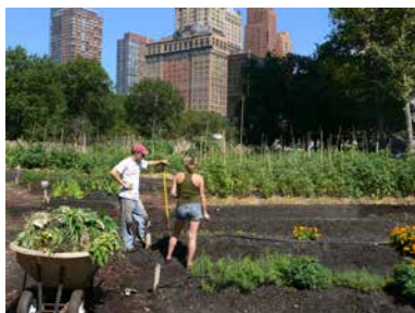
Gemeinschaftsgarten im Herzen von Manhattan – offen für alle Bürger und Bürgerinnen und aktive Gartenutzer. Die kleinen Gärten der „Urban Farm at the Battery“ sind zu Fuß bequem von Wallstreet und Broadway zu erreichen.

Hinzu kam, dass die Stadt ihre Zuständigkeitsbereiche änderte. Gemeinschaftsgärten wurden bisher von der Parkbehörde verwaltet. In Zukunft sollte das Amt für Wohnungsbau die Kleingartengrundstücke verwalten. Damit war ein Interessenkonflikt, nämlich der von „Bauen“ einerseits