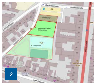
Lageplan des Gemeinschaftsgartens HirschGrün, Aachen, Deutschland.