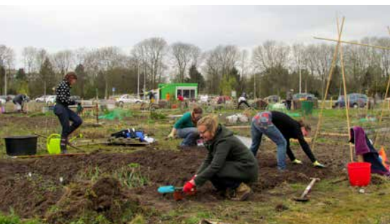
Erstellen eines Gemeinschaftsgartens

manchmal mit einer hohen Biodiversität und ungewöhnlichen Pflanzen, aber in ihren eigenen Gärten und innerhalb der Vereinskultur. Sie organisierten Wettbewerbe für Vereine im Pflanzenbau wie Dahlien, Chrysanthemen und Lathyrus odoratus . Die Gärtner waren gut im Wissensaustausch, sowohl im Bereich des Ziergartens, als auch des Gemüsegartens. Einige Gartenanlagen regen die Besucher an, die Pracht zu genießen, als Akt des sozialen Verhaltens gegenüber Nichtgärtnern. Seit vielen Jahren setzt sich der AVVN dafür ein, dass sich Gartenvereine nach außen öffnen, nicht nur aus sozialer Sicht, sondern auch, um nicht isoliert zu werden. Leider mit wenig Erfolg damals.