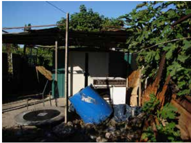
„Barackengarten“ in Nîmes. Dieses Modell von Garten ist verantwortlich für das schlechte Bild der Arbeitergärten und jeder wünscht sich ihr Verschwinden.