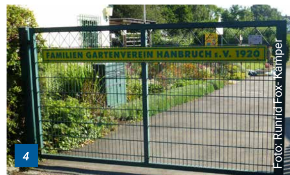
Typischer Kleingarten in Aachen, Deutschland, gegründet 1920.