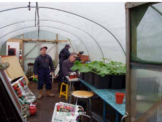
Gemeinschaftsgarten – Das Northcliffe Projekt für Menschen mit Behinderungen

Präsident National Allotment Society (Nationaler Kleingärtnerverband)