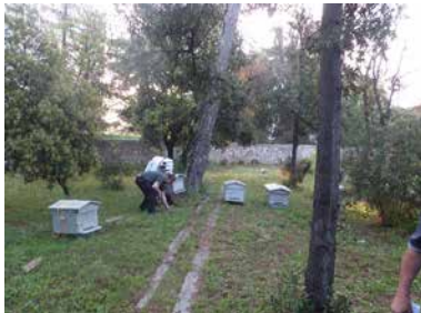
Freiwillige Gärtner stellen den Bienenstock in der Mitte des Pinienhains in der Kleingartenanlage von Mazargues auf.

Heute wird die Ausstattung (Zäune, Lauben, Wege, Wasserzufuhr, Wasserbecken, Kompostierer, Geräteschuppen, Obstbäume, etc.) oft ganz oder teilweise von den lokalen Behörden geliefert. Das Grundstück wird in Parzellen unterteilt und die Gärtner müssen einen jährlichen Beitrag an den Verein zahlen, welcher so ein Budget erhält, um für den Unterhalt und die Verbesserung der Anlage zu sorgen. Die Statuten und das interne Reglement des Vereins werden mit den Behörden diskutiert, bevor sie dann von den Kleingärtnern angenommen werden.