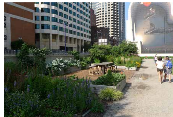
Essbare Gärten in öffentlichen Grünanlagen in Boston.