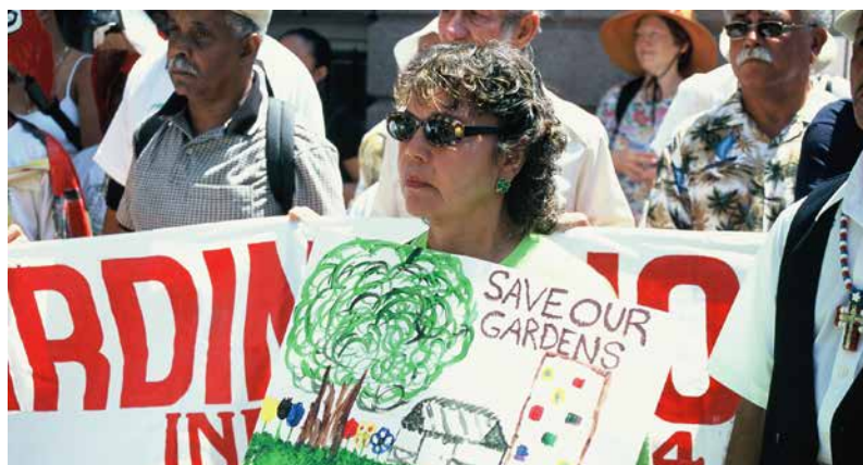
Bürger und Teilnehmer der ACGA-Tagung protestieren 2002 für den Erhalt der Gemeinschaftsgärten in NYC.

Als Anfang der Neunzigerjahre die Grundstücke in einzelnen Stadtvierteln – so auch in der Bronx – durch den vermehrten Zuzug von neureichen Bürgern massiv im Wert stiegen, wurden zahlreiche Gärten dem Erdboden gleich gemacht, um so Platz für den Bau neuer Häuser zu schaffen. 1991 gab die New Yorker Wohnungsbaubehörde Ihre Absicht bekannt, dass sie 35 neue Sozialwohnungen auf Gartengelände errichten werde. Die Gartenanlage war ursprünglich von einer Jugendorganisation gegründet worden. Der Projektname: „The Dome – Development of Opportunities through Meaningful Education“ (Das Heim – Entwicklungsmöglichkeiten durch sinnvolle Bildung) stand Pate für das soziale Programm dieser Gärtnergemeinschaft. Die Gartennutzer waren damals sehr wohl von der Notwendigkeit des sozialen Wohnungsbaus überzeugt. Da es in der näheren Umgebung