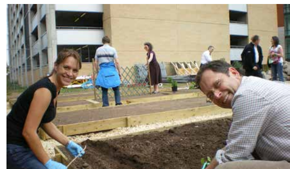
Kleingartenparzellen im Stadtzentrum für Mitarbeiter eines Unternehmens.