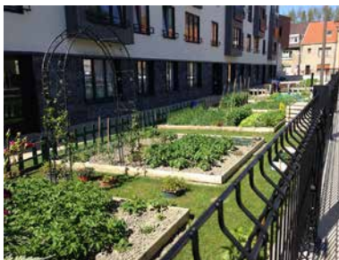
Gärten am Fuße eines Wohnblocks in Saint Martin-lès-Boulogne (Norden).