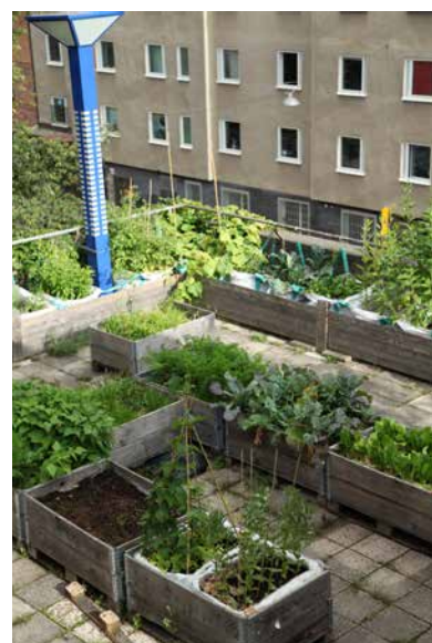
Blick über den Anbau am Dach