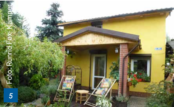
Kleingartenparzelle in Poznań

auch hier mittlerweile die Nutzung als Freizeitgärten (Abb. 5). In einigen Ländern (z. B. Lettland) sind viele dieser Gärten mittlerweile von Leerstand bedroht und / oder wurden zugunsten städtebaulicher Entwicklungsprojekte aufgegeben.