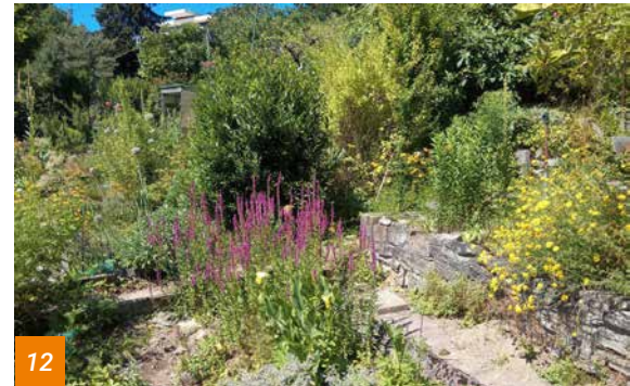
Foto 12: Diversité dans un petit espace: cultures, plantes vivaces, bosquets, plantes sauvages, chemins, murets, endroits ouverts ...Zone de jardin dans l'ensemble de jardins familiaux de Wehrenbach, Zurich