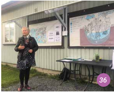
36 Conférence sur les principes de la structure des jardins de pluie