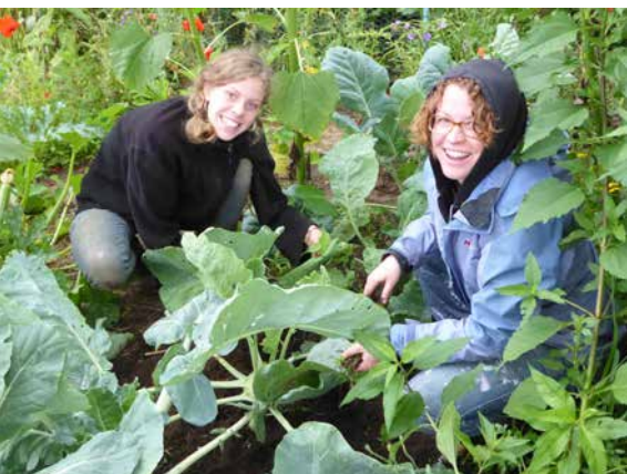
Etudiants de l'université de Lüneburg dans un jardin de permaculture

Ancien président de la fédération nationale des jardiniers associés de Basse-Saxonie