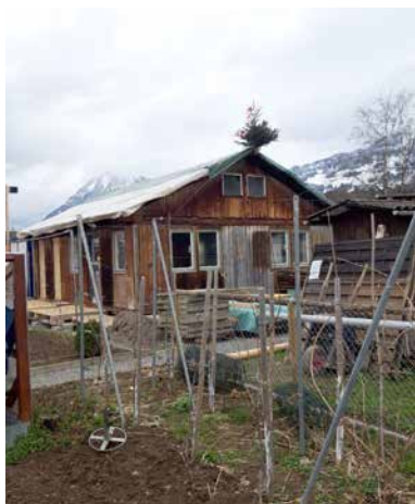
Fête de l'achèvement du gros œuvre de la maison associative