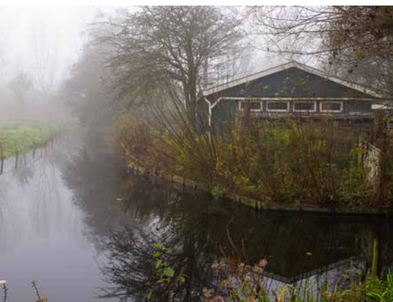
Brume de matin