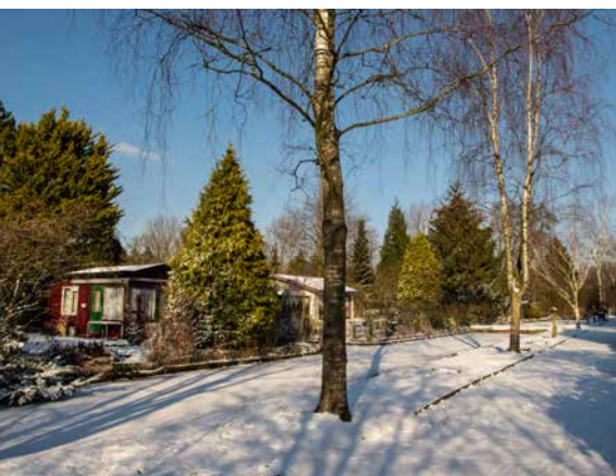
Allées et côtés enneigés

94 : ils y sèment des graines, prennent soin des plantes, cueillent les fruits, goûtent aux légumes sains et apprennent ainsi des jardiniers et les uns des autres à apprécier ce que produit Mère Nature.