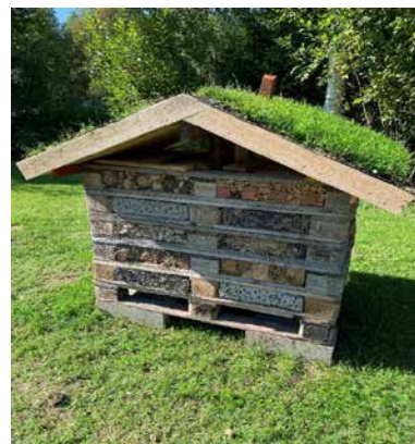
Hôtel pour abeilles dans l'arboretum.

L'ensemble de jardins familiaux – Dalkarlsliden à Skellefteå a reçu le diplôme de la Fédération Internationale pour des projets innovants