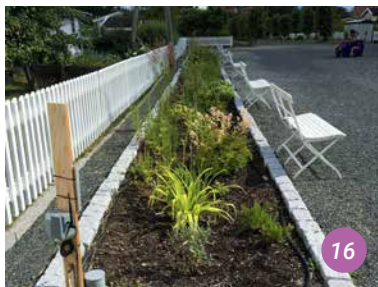
18 Nouvelles plantations qui ne montrent pas encore de fleurs