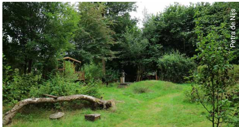
Terrain de jeu naturel

Nieuw Vredelust (Nouvelle Vredelust) est un parc de jardins à Amsterdam-Duivendrecht avec 103 jardins. L'ensemble a été fondé en 1960 et est le successeur des jardins de Vredelust, qui à l'époque, a dû faire place à la construction de la prison d'Amsterdam.