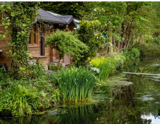
Végétation luxuriante des berges

insectes. Des plantes indigènes, locales et sauvages poussent sous les arbres autour du parc. A tout moment de l'année, les oiseaux se cachent et nichent dans les murs de branches et les rangées de haies.