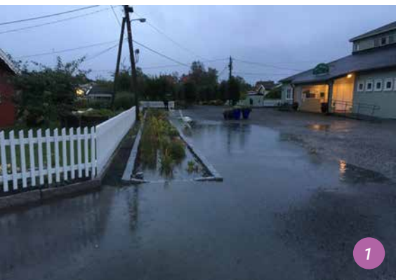
1 Test des Jardins de pluie nouvellement aménagés suite au stress provoqué par des pluies extrêmes

Projet de gestion des eaux pluviales sur l'ensemble de jardins familiaux de Sogn à Oslo, Norvège