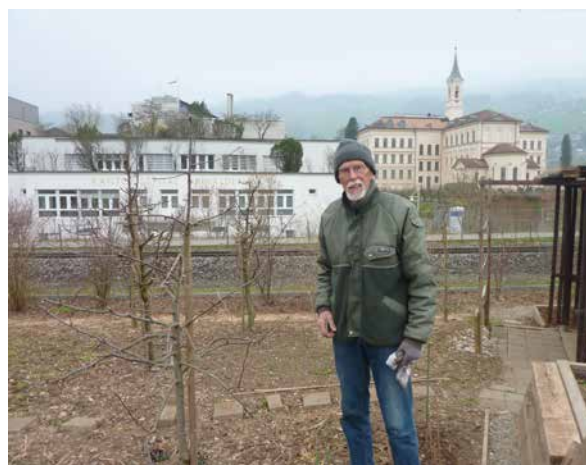
Expert en culture fruitière