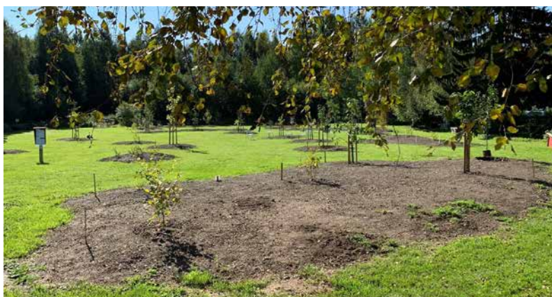
Les deux autres pelouses ont été transformées en prairies, ce qui favorise également la biodiversité.

Pour financer le projet, ils ont également demandé et obtenu en 2020