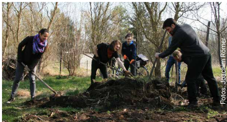
„Jardin de l'Avenir“ dans l'ensemble de jardins familiaux « Moorfeld » à Lüneburg

Nous sommes Urban Gardening – depuis 1814. Il n'y a pas de meilleure façon de décrire le fait que les jardins familiaux font partie intégrante des espaces verts communaux. Outre les traditionnels jardins familiaux, divers projets de jardinage se sont développés au cours des dernières décennies et sont régulièrement regroupés sous le terme d'Urban Gardening.