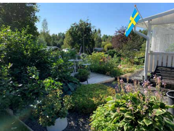
Planter un arbre est la meilleure chose que l'on puisse faire dans son jardin pour favoriser la biodiversité.

Création d'un arboretum, une initiative unique en Suède du Nord