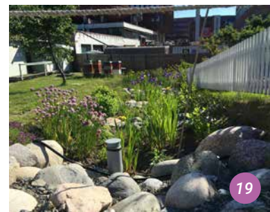
20 Création du jardin de pluie en terrasse pour tester un jardin de pluie sur plusieurs niveaux.