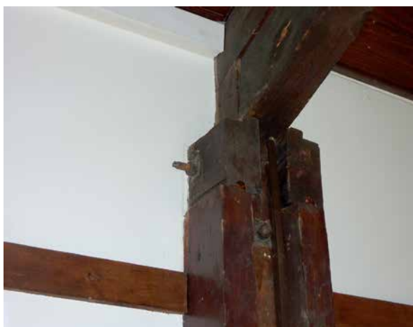
Maison associative-détails en bois