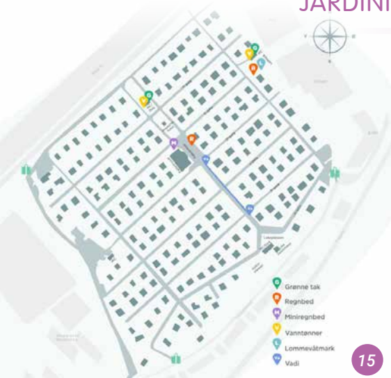
15 Carte avec inscription des différentes structures de jardin de pluie