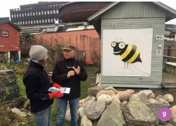
8 rencontre avec les principaux acteurs